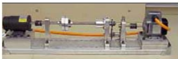
شکل ۱- (ب) دستگاه ساخته شده [7]