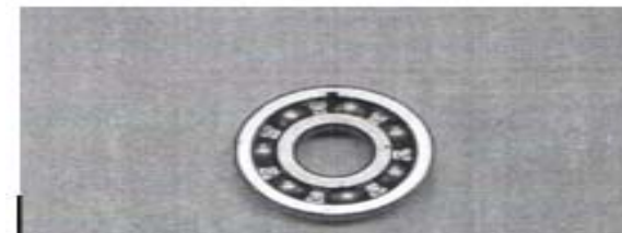
شکل ۲- یاتاقان معیوب [7]