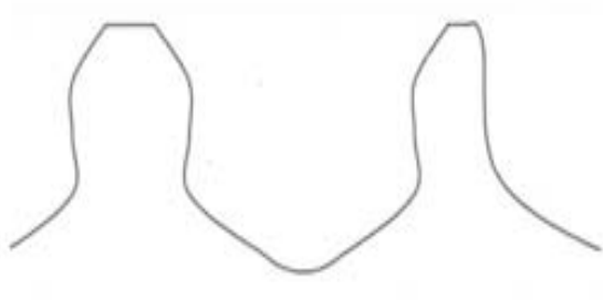
شکل ۳- تصویر بزرگ شده ای از چرخ دنده معیوب